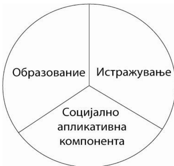
Сл. 1 Трикомпонентна мисија на високообразовните институции